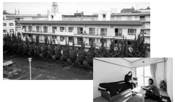
留学生向けアパートの斡旋も行っています。